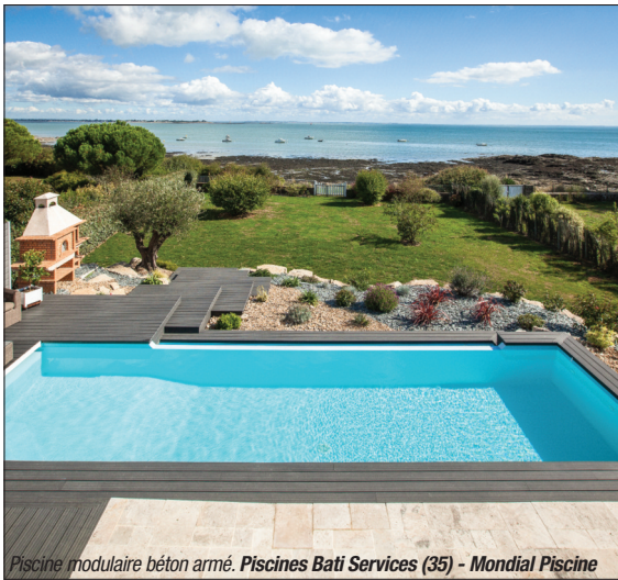
Piscine modulaire béton armé. Piscines Bati Services (35) - Mondial Piscine